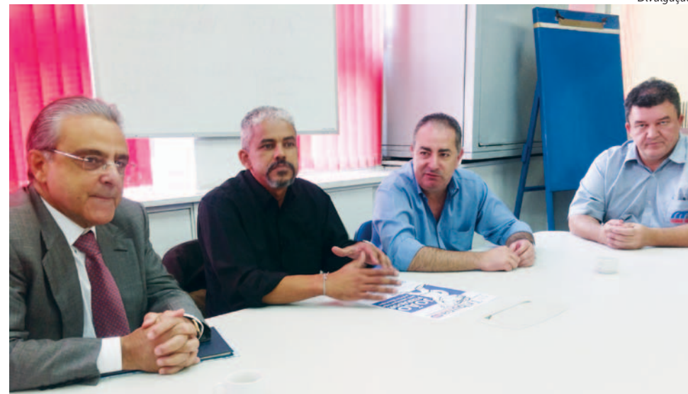
Andrade esteve na Volkswagen e na Sede do Sindicato (abaixo)

"Esse projeto é sinal de uma evolução muito grande nas relações entre capital e trabalho e pode melhorar a legislação trabalhista brasileira, tirando as inseguranças jurídicas que existem para as empresas e melhorando a situação do trabalha-