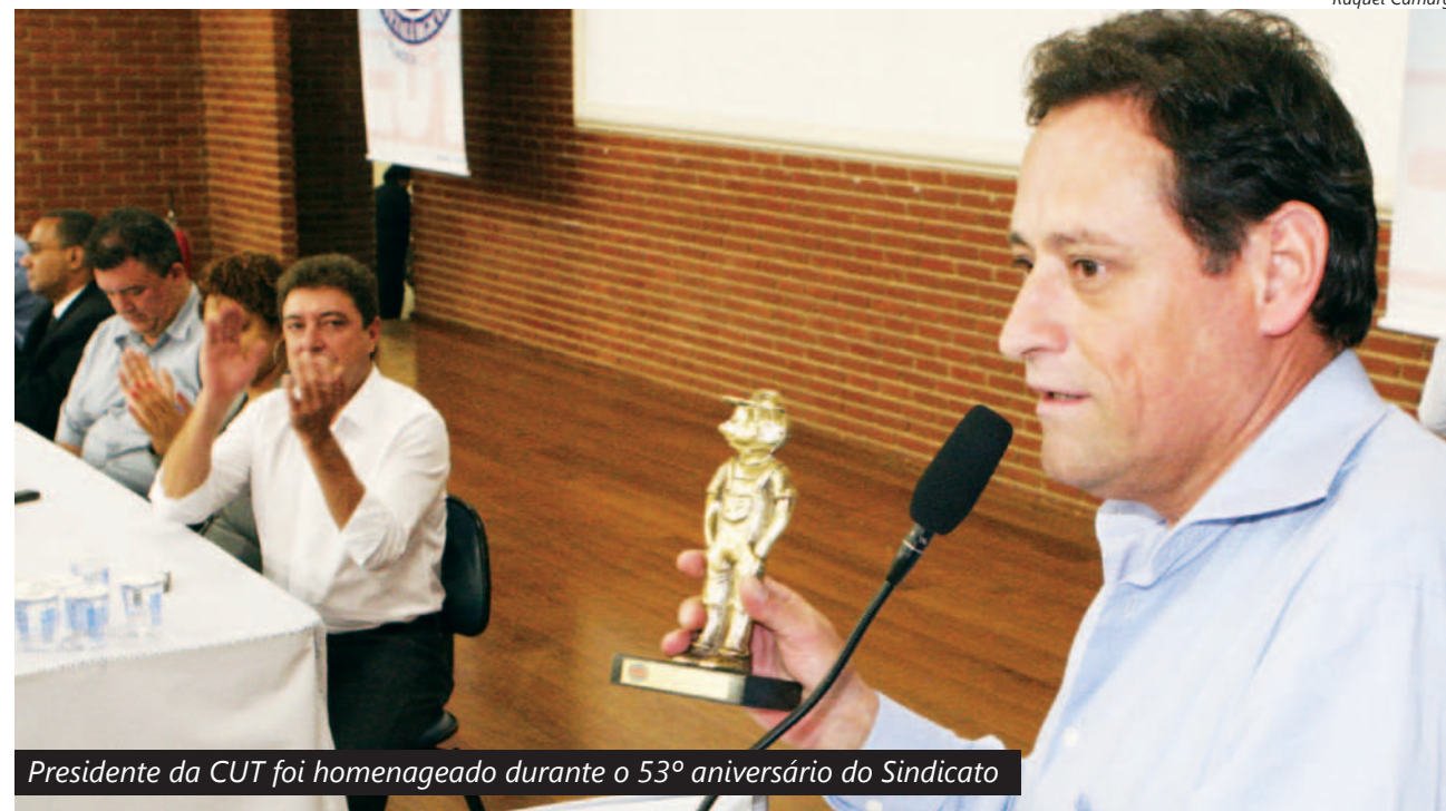
Presidente da CUT foi homenageado durante o 53º aniversário do Sindicato

"É um orgulho para qualquer sindicalista conhecer alguém dos Metalúrgicos do ABC, um privilégio ter amigos nesse Sindicato e, mais ainda, receber o prêmio João Ferrador", disse o dirigente da CUT.